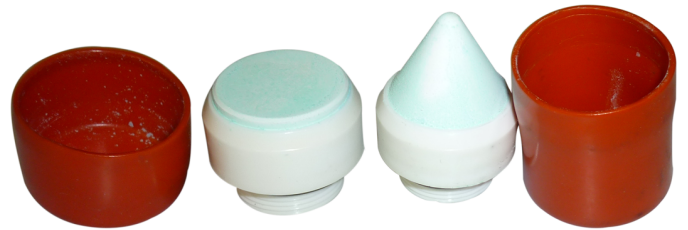
Embout électrode RE5